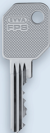
Clé FPS EVVA