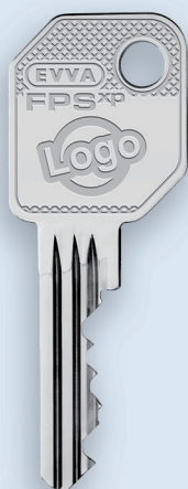
Clé avec logo de partenaire