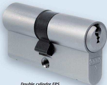
Double cylindre FPS